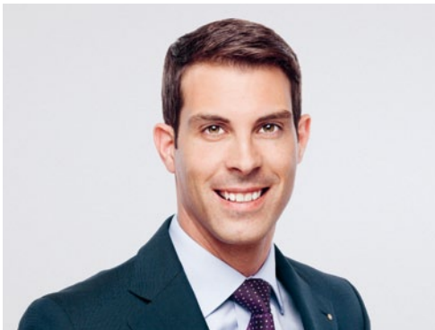
Thierry Burkart, Vicepresidente, Presidente del comitato politico e Presidente della Sezione Argovia

«Prima di riscuotere nuove tasse o imposte sul traffico stradale, bisogna creare un Fondo di infrastruttura per la strada e distribuire meglio i finanziamenti ora disponibili.»